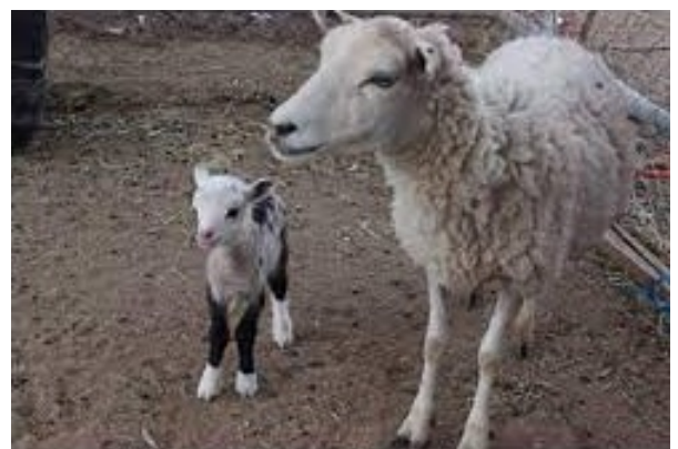
Butterfly et sa maman : une Brebis.