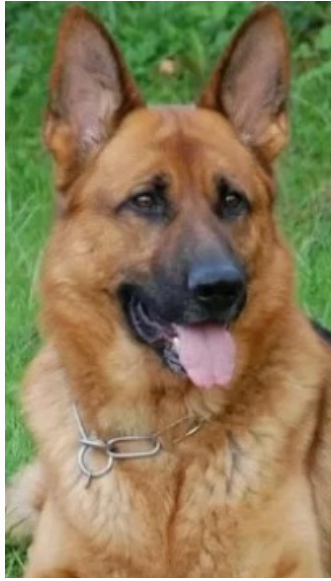
Un berger Allemand