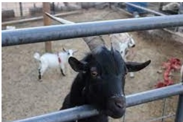
Le papa de Butterfly : Un Bouc.