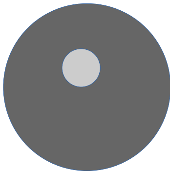
Doc 1 : schéma d'une cellule-œuf.

Les caractères héréditaires se transmettent des parents aux enfants. Ils sont donc déjà présents dans la cellule-œuf qui est à l'origine d'un nouvel individu.