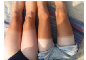
traces de bronzage