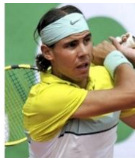
comparé à son bras droit ...