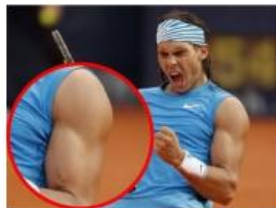
le bras gauche de Rafaël Nadal, le joueur de tennis espagnol