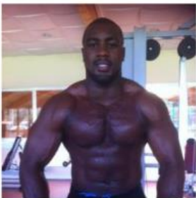
Le champion de Judo français Teddy Riner, est très musclé et très souple.

5) A partir du document ci-dessous, peut-on dire que tous les caractères sont héréditaires ? Justifier.