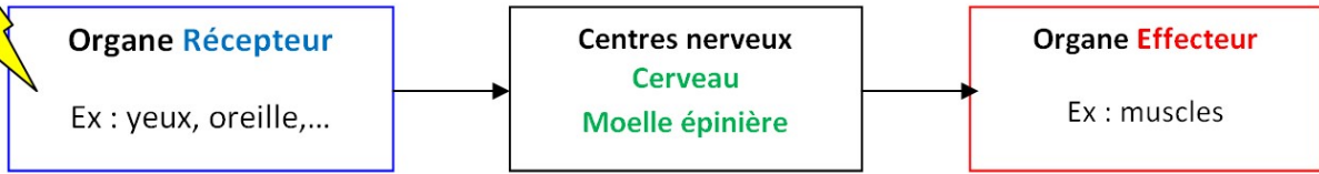
Schéma de la commande d'un mouvement