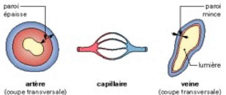
Coupages de vaisseaux

Cœur : moteur de la circulation sanguine, fonctionne comme une pompe de manière rythmée.