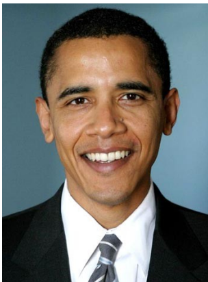
Barak Obama, fils d'un kenyan noir et d'une américaine blanche de souche irlandaise