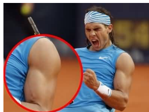
le bras gauche de Rafaël Nadal, le joueur de tennis espagnol