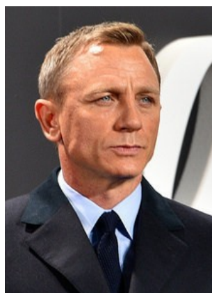
Daniel Craig, 2 parents britanniques à peau blanche