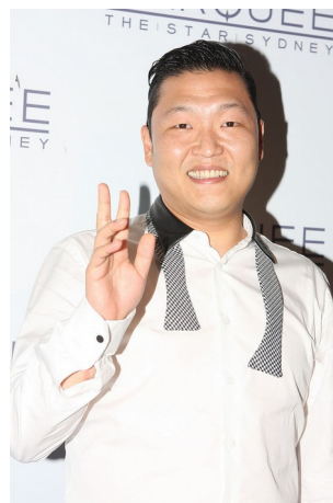
psy, chanteur coréen, parents coréens