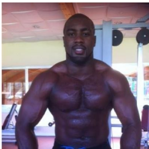
Le champion de Judo français Teddy Riner, est très musclé et très souple.

vidéo : comment lire un arbre généalogique ?