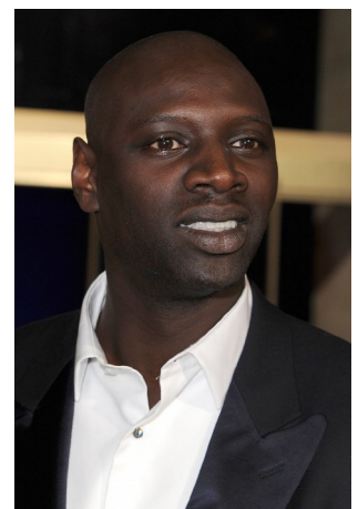
Omar Sy : acteur français(sa mère est Mauritienne et son père Sénégalais)