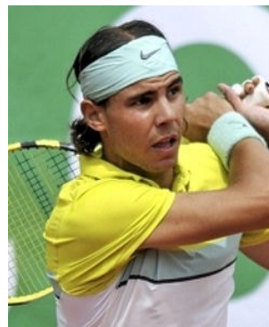
comparé à son bras droit ...