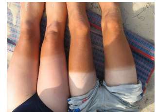
traces de bronzage