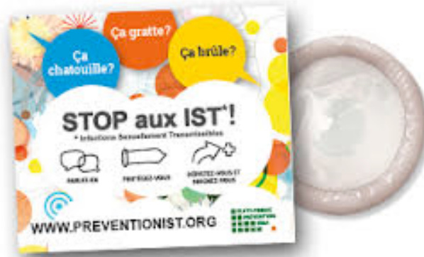
Préservatifs masculin et féminin.