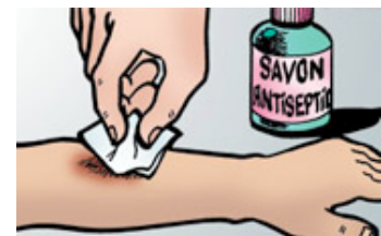
Désinfecter une plaie.