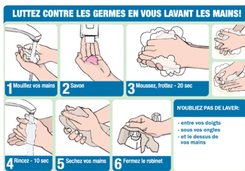
Comment bien se laver les mains.