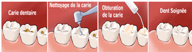
Soigner une carie.