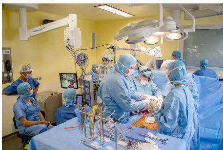
Opération au XXe siècle