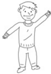
Animal : l'être humain