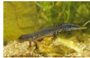
Animal : le triton

Pour trouver le point commun entre les organismes vivants, nous allons utiliser un microscope . Le microscope permet de voir les éléments microscopiques , invisibles à l'œil nu (Voir fiche méthode ).