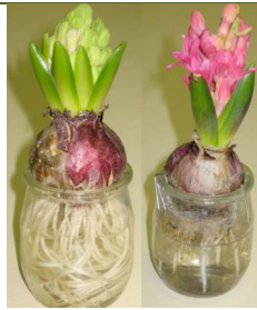
Végétal : la jacinthe